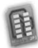
Nr 1a podstawowa płytki elektroniczna (chip)